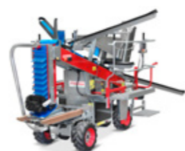
Pluk-O-Trak 320 met optie elektrische plukbanden