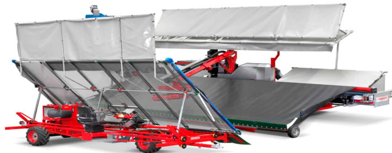
Combinatie volautomaat en opvang zeilwagen