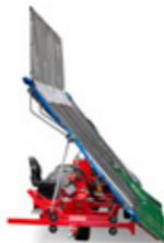
Opvang zeilwagen zijaanzicht