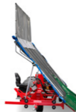
Opvang zeilwagen zijaanzicht